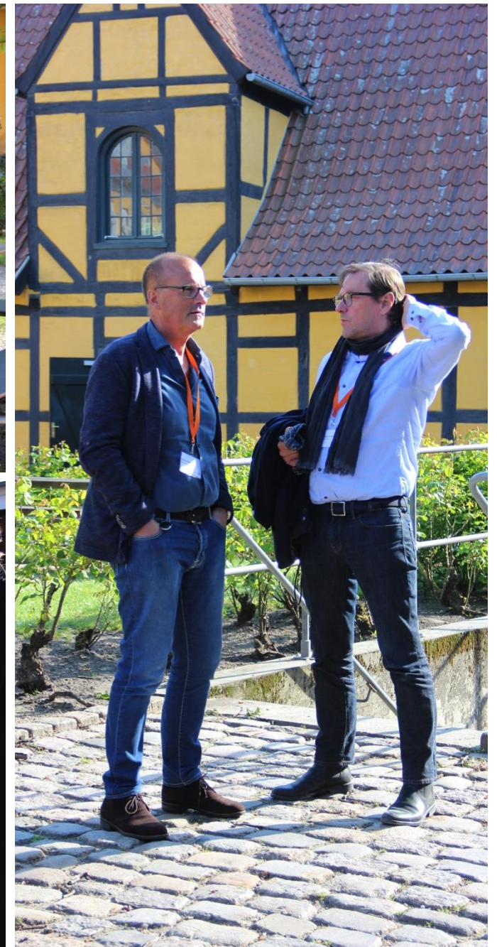
Der blev også tid til at nyde en sandwich og en kold drik i Fæstningens Materialgårds solfyldte gårdhave.