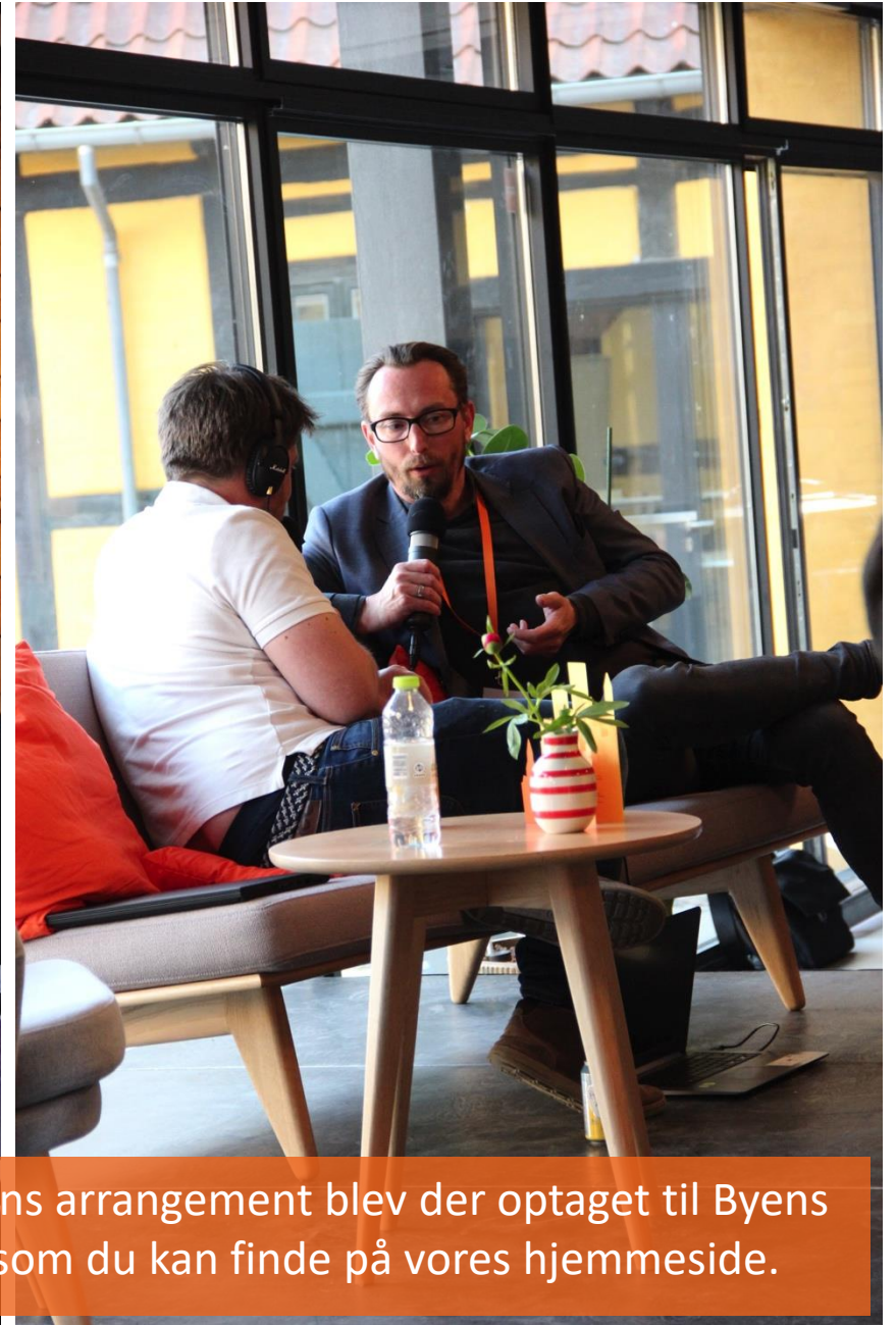
Til aftenens arrangement blev der optaget til Byens Podcast, som du kan finde på vores hjemmeside.